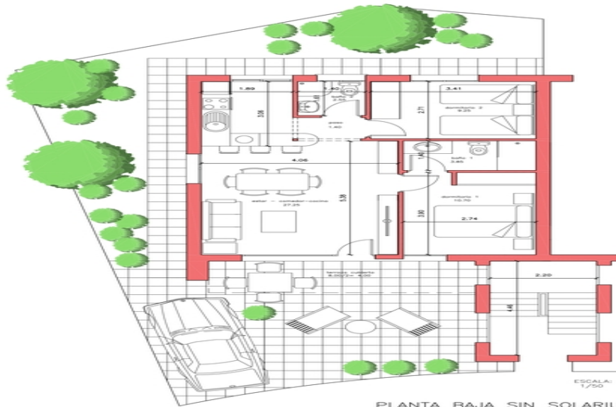
PLANTA BAJA SIN SOLARIUM VIVIENDA 054 SUP. PARCELA= 151,90 M2.

SUP. UTIL : 59,00 M2. SUP. CONSTRUIDA: 70,00 M2. SUP. DE PARCELA NETA: entre 117,00 y 201,00 M2.